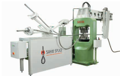
Optional Rigging Arm. View Page 29.

Our 4000t Down Stroke Press sets itself apart thanks to its very good accessibility and the piston located on top. This means that the workpiece remains in position during swaging and is particularly simple to finish.